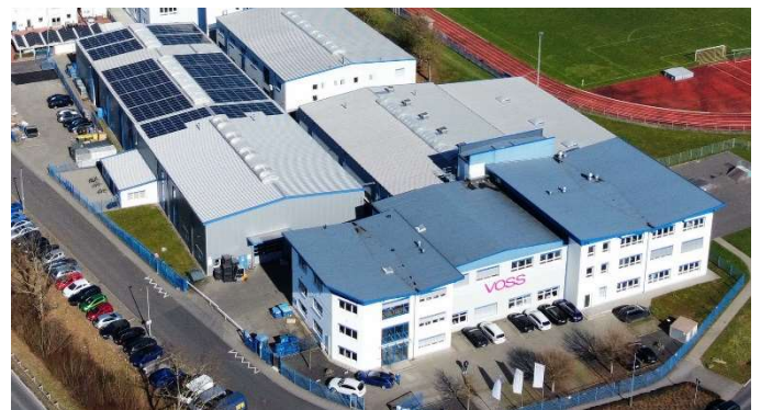
Fotovoltaikanlage auf Dachflächen von VOSS in Gründau